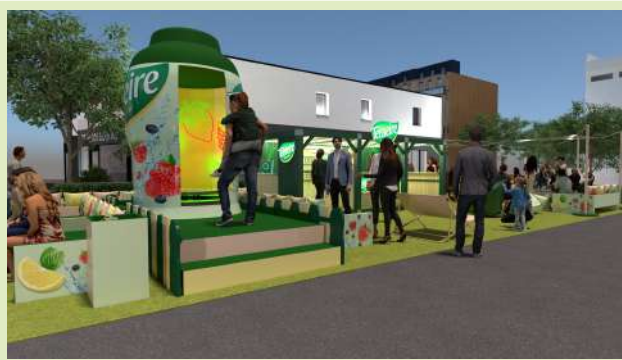
Vue 3D de l'animation Teisseire sur la Fan Zone

Des dégustations gratuites – Nul doute que Teisseire saura gagner le cœur des Français, en étant également aux abords des départs et arrivées pour rafraîchir les spectateurs avant le passage du peloton .