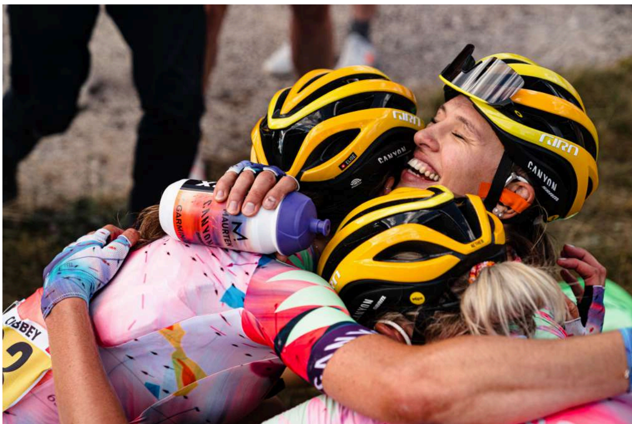
Tour de France Femmes avec Zwift - 2023