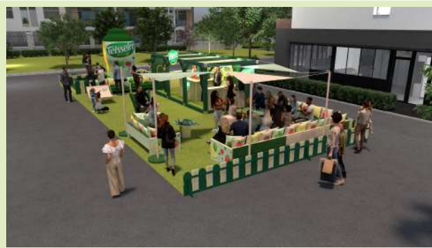
Vue 3D de l'animation Teisseire sur la Fan Zone