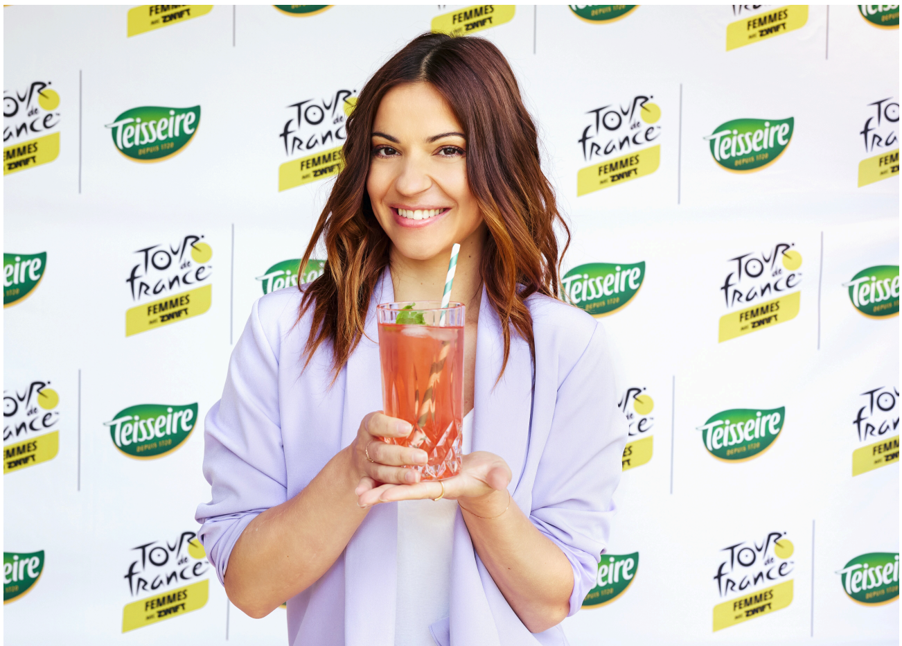
Denitsa Ikonomova ambassadrice de la marque de sirop Teisseire