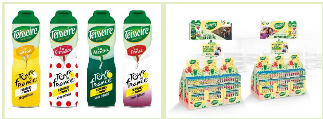
Bidons collector Tour de France 2024